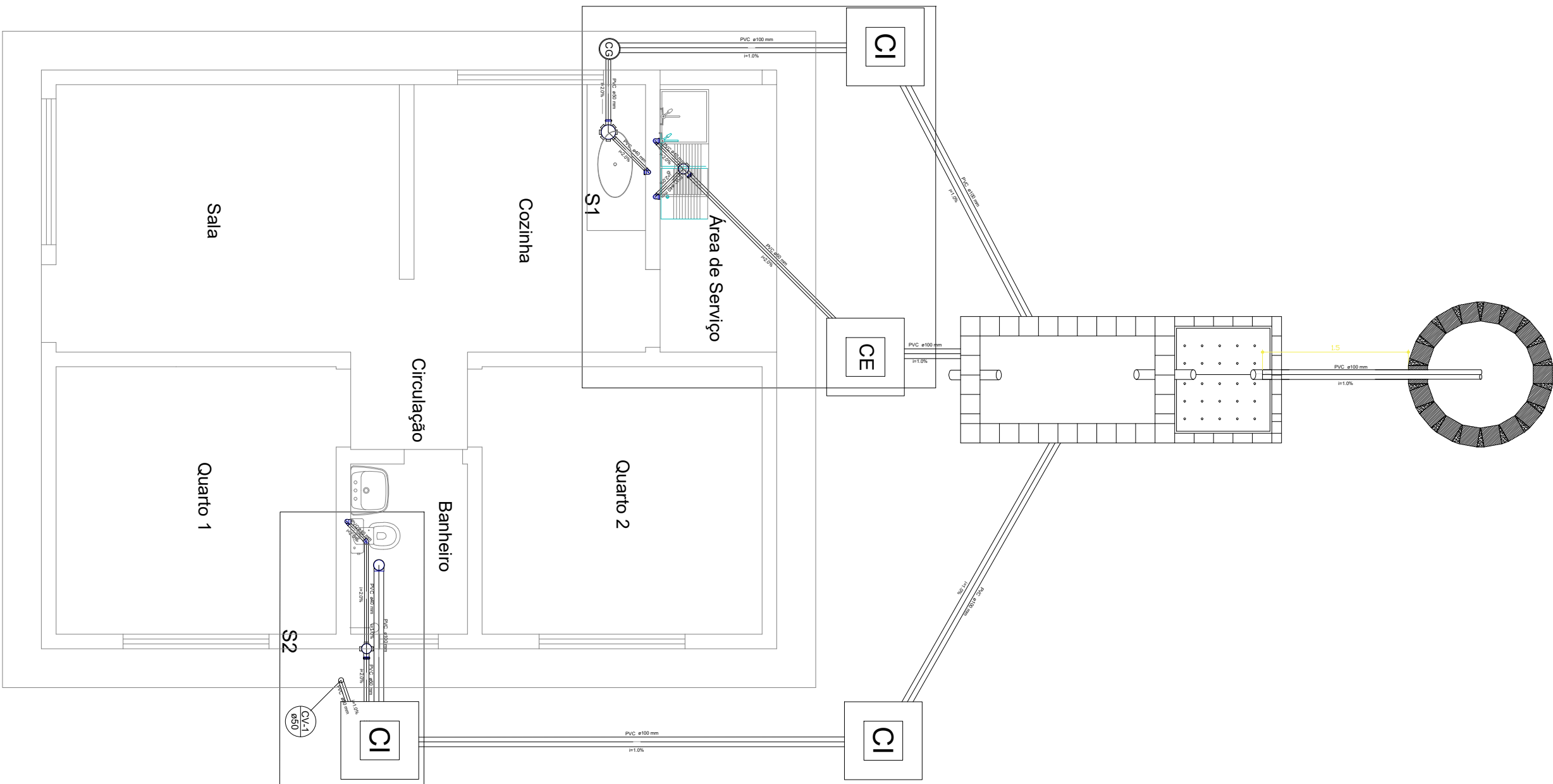
PLANTA BAIXA DE DISTRIBUIÇÃO - TÉRREO ESCALA: 1/50